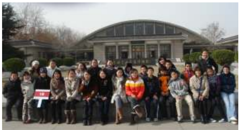
蒙古团和美国团营员们摄于西安兵马俑博物馆