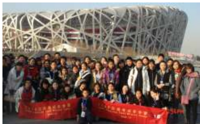
蒙古团和美国团营员摄于北京“鸟巢”前